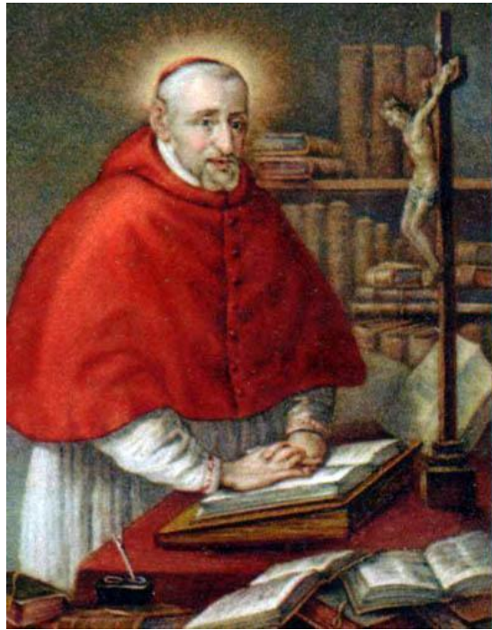
San Roberto Belarmino Patrono de los Catequistas y Catecúmenos Ruega por nosotros